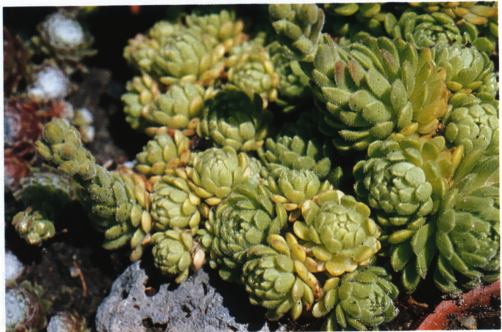
Rosularia chrysantha.

Zoals overall verschilt men hier nogal van mening. Hier wordt in principe de indeling van Egli (1988) aangehouden. Hij verdeelt de Rosularia 's in ruimere zin, in vier groepen: 1. de sectie Chrysantha met vier