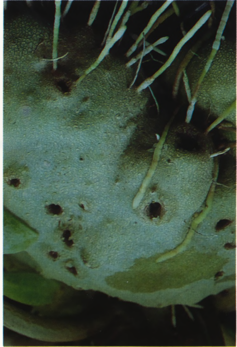
De knol van Hydnophytum mosleyanum met daarin duidelijk zichtbaar de spontaan gevormde gangen die toegang bieden voor mieren naar de holle ruimten in de knol

De bloemen komen te voorschijn langs de stengel, tussen de bladlittekens, zijn ongesteeld. Na (zelf)bestuiving worden bessen gevormd. Na rijping worden deze veelal door mieren versleept naar een plaats op of langs de boomstam, waarna kieming plaatsvindt. Het is opvallend dat de mieren die voortdurend in en uit de knol gaan en zich langs de boomstam begeven dat deze een spoor van klei, dat zij vanaf de grond mee naar boven nemen afzetten tegen de boomstam. Het is juist daar op die plekken dat het zaad gedeponereerd wordt en zal kiemen in een omgeving waar zij direct als jonge kiemplant kunnen profiteren van het organische materiaal dat daar door de mieren is afgezet. Een eveneens veel voorkomend verschijnsel is dat op de