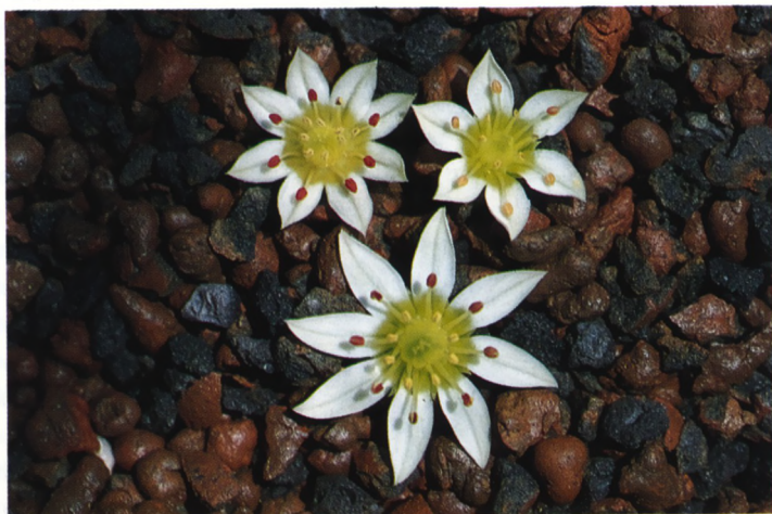
Bloemen van Rosularia alpestris

hort. Het is een soort die het relatief goed doet in de tuin en in juni met lichttroze bloemen bloeit. De nu onder R. sempervivum vallende soorten zijn R. sempervivum , R. libanotica , R. radiceflora , R. pestalozzae en R. persica . Egli komt tot deze samenvoeging, omdat er ook populaties gevonden worden met verschillende combinaties van eigenschappen van deze 'soorten'. De vraag is echter of we hier te maken hebben met variatie binnen een soort of dat er sprake is van kruising tussen soorten. Onderzoek van de fertiliteit in deze populaties zou hier uitkomst kunnen geven. In ieder geval doet hij de variatie weer recht