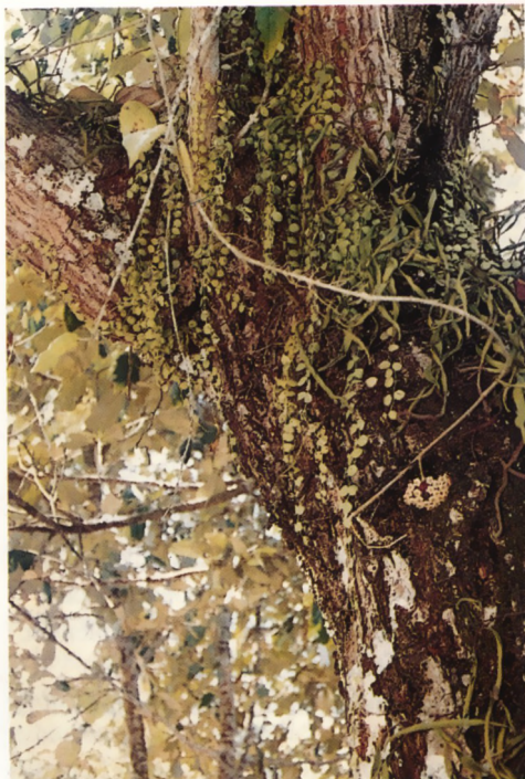
Dischidia nimularia en Hoya diversifolia op de Andaman-eilanden

Deze familie, die vooral in de tropen voorkomt, en met enkele soorten in de gematigde zones, telt 78 genera met 520