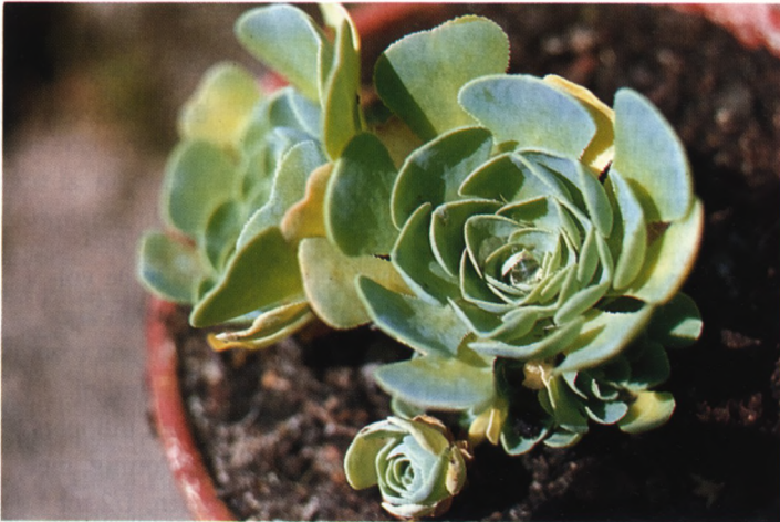
Rosularia sempervivum ssp. glaucophylla

soorten van Turkije, 2. de sectie Rosularia met de tien andere 'echte' Rosularia 's. 3. Verder deelt hij zeven soorten van Sempervivella sedoides en Sedum hirsutum in bij de sectie Sempervivella . 4. Sempervivella acuminata daarentegen komt met drie andere soorten in de sectie Ornithogalopsis terecht. Dus in totaal hebben we 4 secties met 25 soorten.