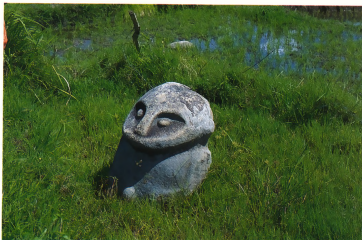
Megalieten in de Bada-vallei

veel vogels die we echter niet te zien kregen. Op een open plek, waar de bomen waren omgehakt, aten we onze lunch op. In de omgehaalde bomen groeiden veel hoya's en dischidia's, waar we natuurlijk weer het nodige van verzamelden. Kort daarna kwamen we aan de rand van het oerwoud en moesten we door een heel nat gedeelte met grote plankwortelbomen, zodat niemand er met droge voeten vanaf kwam. We kwamen uit in rijstvelden. Aan de rand waren de bomen 2 à 3 meter hoog. In één van de bomen vonden we een Hoya aff. incurvula , een Hydnophytum en een orchidee. Een ander bekende plant die opviel was de Asclepias curassavica . Al met al was onze eerste oerwoud'expeditie' zeer succesvol.