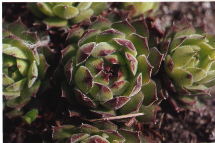
Sempervivum ruthenicum .

Evenals in andere delen van Europa kunnen we ook in Rusland geen cactussen vinden die in het wild groeien. Maar gelukkig groeien vele soorten van de grote en wereldwijd verspreide familie van de Crassulaceae op vele standplaatsen in het Europese en Aziatische deel van Rusland. Van de meer dan 1400 soorten groeien er in Rusland ongeveer 120, waarvan sommige endemisch. De hier groeiende soorten horen tot 3 subfamilies: Sedoideae, Sempervivoideae en Crassuloideae. De voornaamste geslachten zijn Sedum , Pseudosedum , Rhodiola , Sempervivum , Umbilicus , Orostachys , Tillaea en Rosularia . Op ongeveer 30 km van St. Petersburg, aan de zandige noordkust van het Finse zeebekken, groeit Sedum acre . Ze is vooral te vinden onder de struiken aan de oever of samen met droogteminnende grassen in de duinen. De mensen die op het zandige strand zich in de zon laten bruinen liggen letterlijk bijna met hun neus in deze planten. De grote kussens, die in het begin van