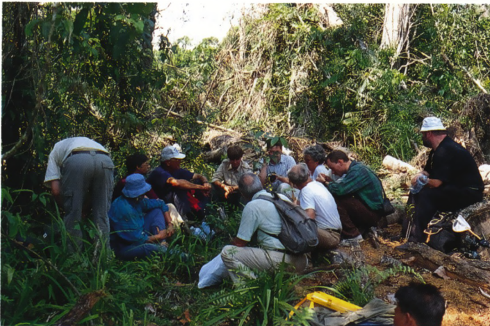
Op een open plek waar de bomen waren omgehakt aten we onze lunch op.