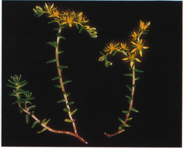
Fig. 7. Sedum oryzifolium .

4. Phedimus Rafin. Stengels vaak aan de basis verhout. Bladen vlak, grof getand. Bloemen 5-tallig in dichte cymeuze bloeiwijzen.