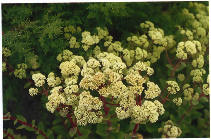
Sedum telephium ssp. maximum , op de Floriade in Zoetermeer, augustus 1992.

Deel 1 [1980], onder redactie van J. Menema c.s., behandelt de uitgestorven en zeer zeldzame planten. In dit deel treffen we S. telephium ssp. fabaria (Koch) Kirschl. aan. Slecht één vondst (bij Grave) wordt van deze subspecies vermeld. In de begeleidende tekst wordt gezegd: "Alle geraadpleegde flora's gebruiken andere kenmerken ter onderscheiding van de ondersoorten van S. telephium , terwijl Fröderström (1930) in zijn monografie van het geslacht Sedum aan het taxon fabaria slechts de status van variëteit toekent. Gezien het Nederlandse materiaal van S. telephium [dat van ssp. maximum (L.) Krocke uitgezonderd] en de verdeling van bepaalde kenmerken daarover, lijkt het noodzakelijk om aan deze complexe soort eerst een uitvoerig kenmerkenonderzoek te doen, alvorens te besluiten welke ondersoorten van S. telephium er naast subsp. maximum in ons land voorkomen."