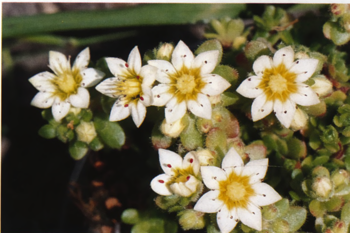
Bloem van Rosularia sedoides

sedoides . Daarom werd deze soort oorspronkelijk o.a. Sempervivella acuminata genoemd. Als synoniemen komen we ook nog Sempervivum fimbriatum Klotsch, S. himalayense en S. mucronata tegen. Egli deelt hem in een ander sectie in dan R. sedoides echter zonder een argument te geven. Het is een plant met een klein sempervivum-achtig rozet met dikke, bijna ronde blaadjes. Hij vormt een naar verhouding dikke caudex in oudere exemplaren. Hij komt voor in Noord-India, Kazakstan, Afghanistan en Tibet tussen de 2000 en 4500 m. Deze soort heeft slecht 2n = 28