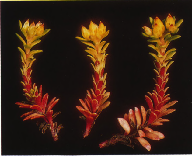
Fig. 8. Sedum morrisonensis .

Eenjarige of overblijvende kruiden, meest zonder knollen of wortelstok, dikwijls met rozetten, zelden met verhoutte stengels of halfstruiken. Bladen met gave bladrand, meestal verspreid, slechts zelden vlak. Bloeiwijzen eindstandig, minder vaak okselstandig. Bloemen 5 (4-12)-tallig, meest met twee kransen meeldraden. Kroonbladen vrij of aan de basis vergroeid (zelden geheel vergroeid).