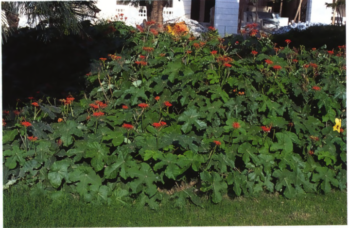
Bloeiende Jatropha . Banagalore, Zuid-India

Met die gedachte in het achterhoofd reisde ik, samen met mijn vrouw, een tweetal keren door India. Daarbij stond mij vaak voor ogen dat ik bij terugkomst onze leden in Drenthe moest kunnen laten zien wat er zoal aan planten te vinden was en dan niet alleen succulenten.