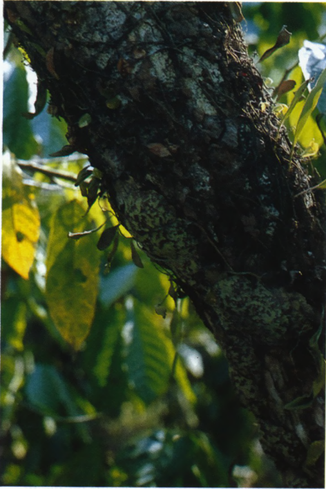
De bladeren zijn mooi getekend en goed gecamoufleerd

nog een keer om planten te bekijken. Ik vond een hoya die drie meter boven de grond hing, maar we konden er met geen mogelijkheid bij, zodat we al dachten zonder stekken weer verder te moeten, maar er groeiden nog meer van dezelfde soort in de omgeving die beter bereikbaar waren. Langs de weg in grote bomen vonden we verschillende exemplaren van de zeer succulente Hoya obovata . Van deze soort was nog geen nauwkeurige vindplaatslocatie bekend. Al een aantal malen had ik langs de kant van de weg een grootbladige plant gezien, maar steeds zonder bloemen. Tot we vlak bij Tentena waren en ik er één zag met grote gele bloemen. Het bleek een soort Ipomoea (Merremia peltata) te zijn waar we natuurlijk zaad van verzamelden. Onduidelijk is nog of het een soort is met knolvorming. De volgende dag ging onze tocht door het