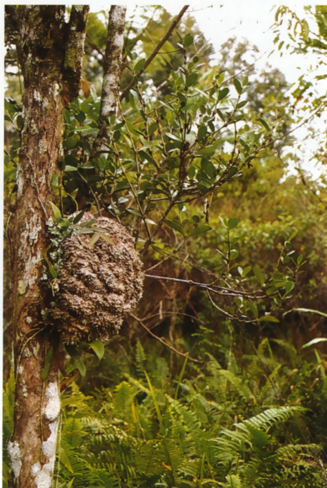
De knol van Hydrophytum spec. op een open locatie aan de rand van het bos. Opname: Lake Kutubu, Papoea Nieuw Guinea.

Het begrip succulent laat zich als zodanig zeer breed interpreteren. Als we zeggen dat het planten zijn die zich op een of andere wijze hebben aangepast om een korte of langdurige droge periode te kunnen overleven, dan is succulentie een gebied dat zich niet goed laat afbakenen. Het zijn dan ook niet alleen planten die in de grond groeien, niet alleen voorkomen in halfwoestijnen of savannes. Op de vraag vanuit de redactie om eens aandacht te schenken aan succulenten uit Zuid-Oost Azië, is een eerste gedachte wellicht dat dit een niet voor de hand liggend gebied is om iets over succulenten te schrijven. Bij nadere kennismaking met de flora in de verschillende gebieden kom je er dan al snel achter dat dit een zo'n groot areaal van planten omvat dat je direct gedwongen wordt om je te beperken tot slechts een kleine groep. De keus is gevallen op de familie van de