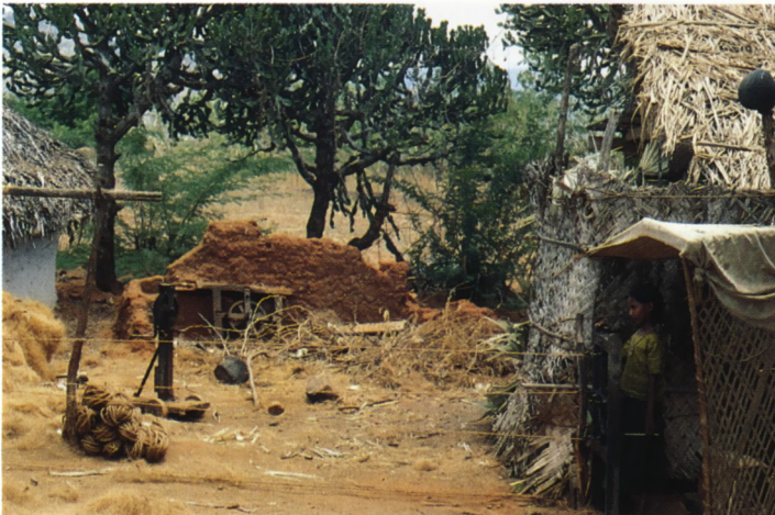
Zuid Tamil Nadu. Touwdorp met Euphorbia's.

India en succulenten. Niet direct een combinatie die voor de hand ligt, zou je zo denken. Hoewel, bij een land dat zich uitstrekt van zo'n 5 tot 35 graden noorderbreedte, zou de aanwezigheid van succulenten niet al te verrassend moeten zijn.