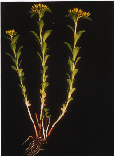
Fig. 4. Phedimus kamschaticus (= Sedum kamschaticum )