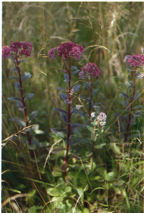
Sedum telephium ssp. purpureum , tussen opschietende grassen in wegberm, augustus 1994.