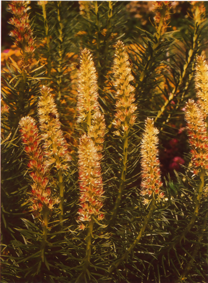
Fig.6 Rhodiola semenovii (= Sedum semenovii ).

afgeplatte of lijnvormige bladen (soms) met een stekelpunt. Bloemen 5-talig, in eindstandige, aarvormige of vertakte, piramidale, dichte bloeiwijzen. Kroon wit (crème) of roze. Met ongeveer 10 soorten in Oost Azië. Bekende soorten zijn: O. boehmeri , O. chanetii , O. iwarenge (Fig. 1), O. malacophylla en O. spinosus . -- Meterostachys Nakai. Verschilt van Orostachys in de sterk vertakte, niet pluim of aarvormige, bloeiwijze en de gedeeltelijk vergroeide kroonbladen. Met 1 soort, M. sikokianus , in Japan en Korea.