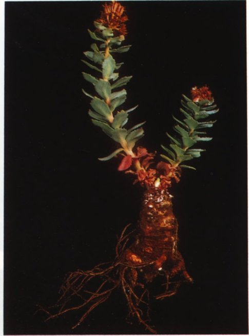
Fig. 5. Rhodiola rosea (= Sedum roseum )

Meest kruiden met tegenoverstaande, succulente bladen met (vele) hydathoden (water/kalk uitscheidende klieren) langs de bladrand. Bloemen 5 (3-7)-tallig, met 1 krans van meeldraden. Kroonbladen meest vrij.