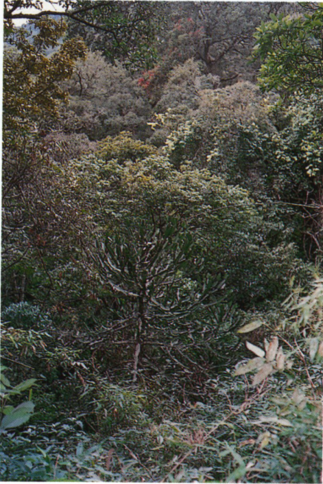
Een volwassen boom van Euphorbia vajravelui

de Indiase soorten uit het geslacht Caraluma (1931) is tot nu toe het enige referentiekader. Nadien is er geen poging meer gedaan om tot revisie te komen.