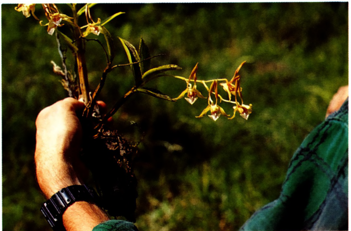
Een onbekende orchidee