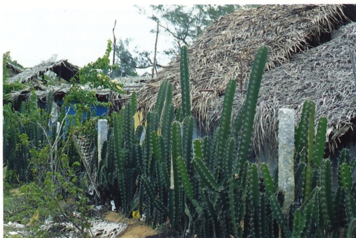
Haag van cactussen. Dradras, Zuid-India.

Het effect op de planten was opmerkelijk. Komend uit een staat met bruine agaves en slaphangende aloë's, zagen we nu schitte-