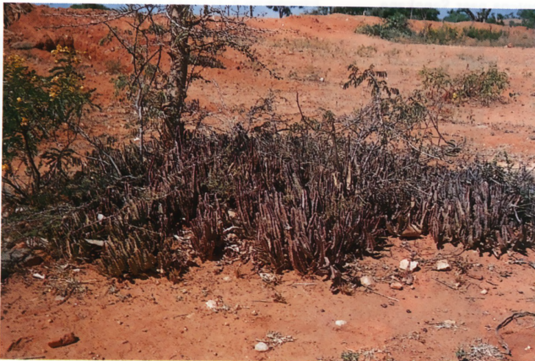
Een groep Caralluma umbellata .

Botanische onderzoekers ontdekken zelfs nu nog wonderbaarlijke schoonheden die zowel de botanici als de verzamelaars versteld doen staan. De flora van India, hoewel rijk en gevarieerd, is relatief arm aan succulente soorten. Het is een min of meer onontgonnen terrein, omdat de meeste succulentenliefhebbers in de wereld