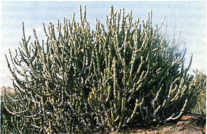
Euphorbia caducifolia in Rajasthan

Deze familie wordt in India vertegenwoordigd door een tweetal geslachten: Dioscorea en Trichopus .