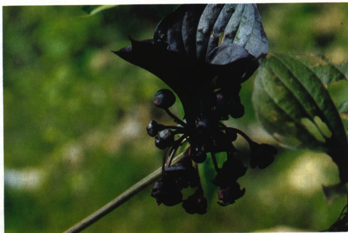
Een Tacca spec. in volle bloei met zwarte vleermuisachtige bloemen

Onder een stuk boomstam vonden we een schorpioen. Meteen was iedereen bezig er een foto van te nemen. Het bleek de enige schorpioen te zijn die we de hele vakantie zouden zien. Er waren ook hele mooie vlinders in het oerwoud en we hoorden