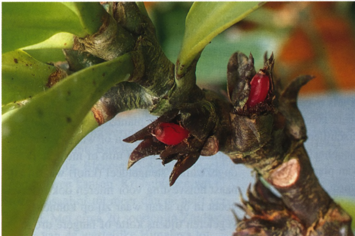
Myrmephytum celebense , de fraaie rode bessen ontstaan na zelfbestuiving