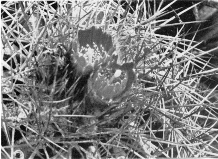
Fig. 8 — PARODIA CAMARGENSIS Buin. et Ritter op de vindplaats.

Bloembladen 12–16 mm lang, 2–3 mm breed, vrijwel lijnvormig, onderaan iets versmald, bovenaan afgerond of kort toegespitst, uit-