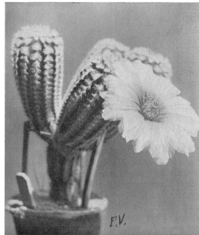
Echinocereus pectinatus .

Nu wilde ik nog even Uwe aandacht vragen voor een andere Echinocereus n.l. E. pectinatus . Zij behoort in een geheel andere