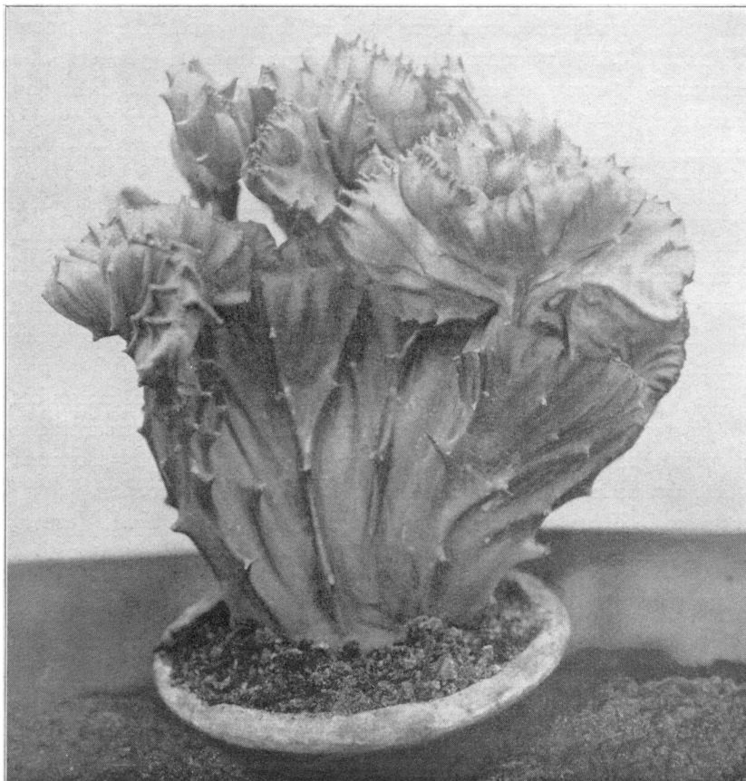
Kamvormige Euphorbia sp.

weinig te zeggen. Volgens Alwin Berger in zijn Sukkulente Euphorbien is de Euph. triangularis een Afrikaansche plant en zou ze dus naar Venezuela en Curaçao overgebracht moeten zijn. Of onze cristata vorm daar nog in 't wild voorkomt kan ik niet zeggen. In Amsterdam en Amstelveen en misschien nog in tal