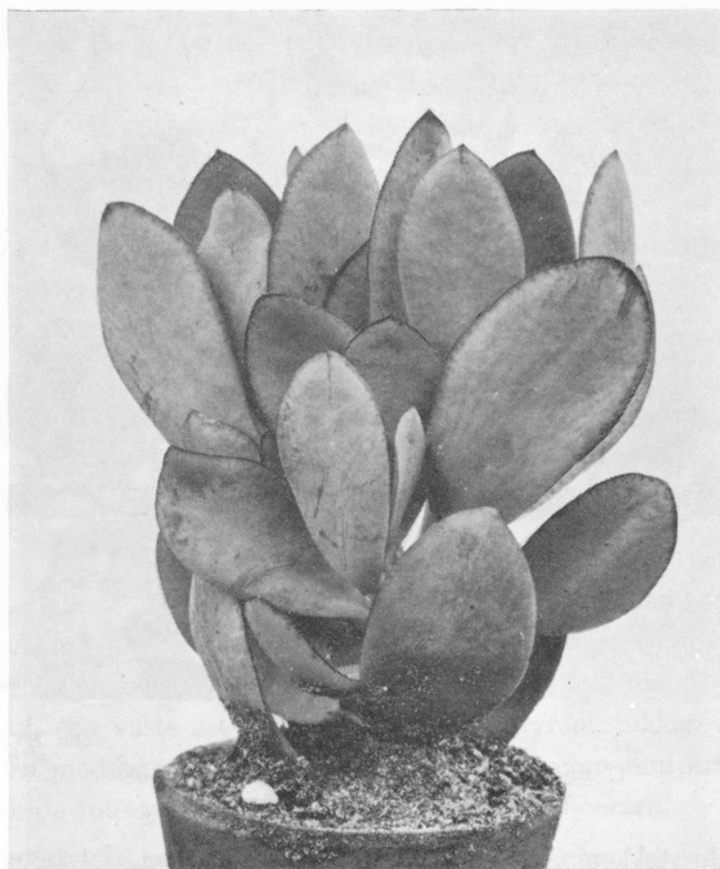
Figuur 34 C. portulacea 'Blauwe Vogel', stekling

We kunnen ons nu afvragen of het wel juist is deze cultivar tot de